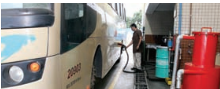
O filtro-prensa eliminou o ruído no abastecimento nas garagens Itaum e Central

O excesso de ruído no abastecimento dos ônibus, um antigo problema, que incomodava tanto os colaboradores quanto os moradores das proximidades da garagem do Itaum, foi resolvido e a solução já começa a ser levada para outras garagens. “Antes, o filtro prensa era muito ruidoso em virtude do motor elétrico. Com a instalação de um filtro (purificador eletrostático) que trabalha com sistema de microfiltração por gravidade, não haverá mais ruído. Além da qualidade do filtro, houve uma melhora também nas redes de consumo de energia e todo o processo de troca de elemento filtrante, que era feito semanalmente, passou a ser semestral”, explica Renato Protti, gerente de Manutenção. Instalado em meados de janeiro na garagem do Itaum, o filtro funcionou tão bem que já está na garagem central. “O resultado foi a eliminação de 100% do ruído. Todos aqui na garagem ficaram satisfeitos e a vizinhança também”, destaca o encarregado da manutenção noturna, Sinésio Oliveira de Souza Filho.