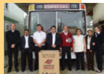
Equipe participante da campanha na empresa

Todos os colaboradores e clientes do transporte público podem participar levando doações em roupas, calçados e cobertores para tornar o inverno mais quente de famílias carentes do município. Realizada há mais de dez anos pela RIC Record, a campanha beneficia milhares de pessoas em todo o estado. A Gidion participa há sete anos da Campanha do Agasalho.