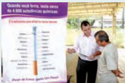
Colaboradores recebem orientações sobre saúde e tabagismo